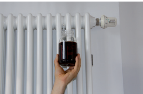
HEIZUNGSWASSER OHNE UMH

Gerne möchten wir über die Erfahrung mit den UMH-Heat-Geräten, welche wir in unsere zwei großen Häuser im Frühjahr 2011 eingebaut haben, berichten. Kürzlich wurden wiederum Wasserproben aus dem Heizungssystem entnommen. Wie schon bei früheren Inspektionen zeigte sich, dass das Heizungswasser völlig klar und schmutzfrei ist.